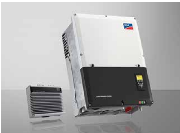
SMA Sunny Tripower Storage 60 mit SMA Inverter Manager